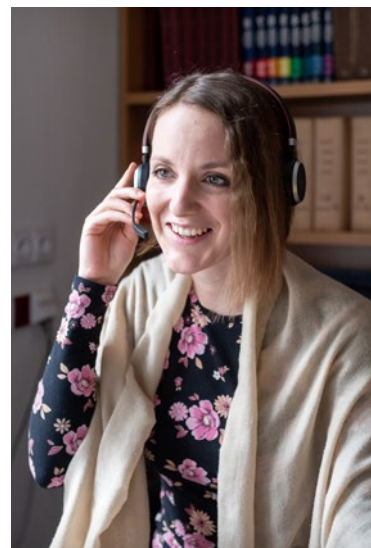
Jazyková poradna ÚJČ

V říjnu 2023 ve spolupráci s Ústavem pro českou literaturu proběhl 11. ročník Školy českého jazyka a literatury pro pedagogy , na němž přednášeli také pracovníci dialektologického oddělení a oddělení současné lexikologie a lexikografie. Tento vzdělávací kurz je určen aktivním učitelům českého jazyka a literatury gymnázií, SOŠ, SOU a 2. stupně ZŠ. Cílem kurzu je účastníkům představit zajímavá témata a poslední trendy v českém jazyce a v české literatuře. Po absolvování kurzu každý pedagog získá nové poznatky a nápady, které následně může aplikovat v praxi při výuce na příslušné škole.