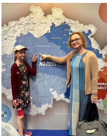
Stánek ÚJČ na Veletrhu vědy

ÚJČ rovněž na vyžádání pořádá přednášky a školení zaměstnanců jiných institucí. V roce 2023 proběhly semináře a další školicí akce například pro Nejvyšší kontrolní úřad, Národní technickou knihovnu, Český rozhlas Praha, META, o. p. s. – Podpora příležitostí ve vzdělávání, a další.